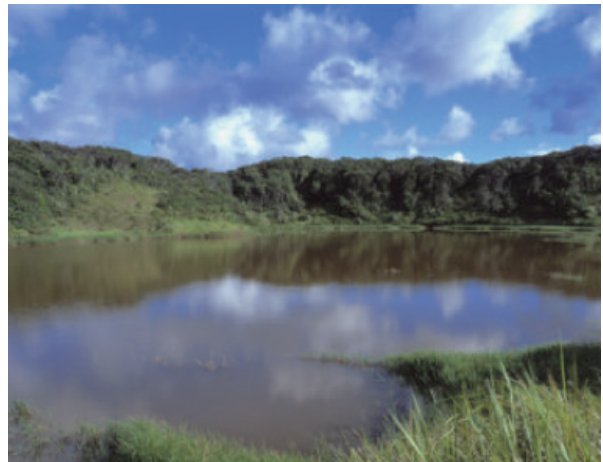
墾丁南仁山南仁湖

認識珊瑚及珊瑚與珊瑚礁的關係。藉由影片介紹、power point簡報，認識珊瑚的種類及珊瑚礁如何成為陸地，進而瞭解珊瑚與珊瑚礁的重要性，並能維護良好的海洋環境。