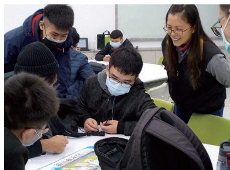
嘉南藥理環工系-涓滴珍惜，水源永續

透過參觀污水廠，體會生活中可能產生的污水，認識污水處理的流程。最後從再生水的製造與利用，理解水資源永續利用的概念。