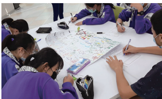
中崙國中-我們的好朋友－瓦特爾