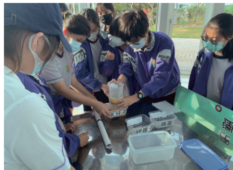
光華國中-我們的好朋友－瓦特爾