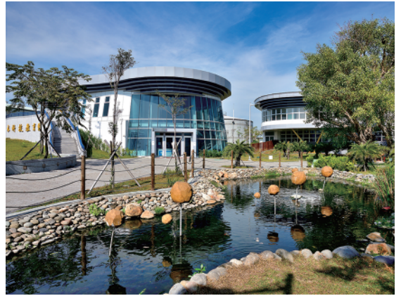
水科技教育館大門

擁有國內首例大型再生水處理廠、以及污水處理設施之外，因緊鄰鳳山溪以及保安濕地公園，讓周圍有豐富的自然與人文資源。鳳山地區的生活污水經過處理廠淨化後可放流至河川以、補注到上游濕地公園及鳳山圳，日漸改善鳳山溪的水質同時恢復河川生態。因天候異常造成的旱象，中心能將放流水再次淨化，供給給工業區使用，增加用水調度彈性，將水權歸民，成為永續水資源的良好典範。