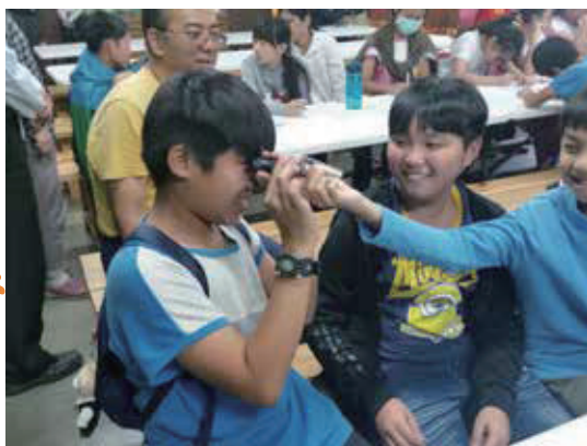
甘蔗的一生活動-甜蜜的負擔 用糖度測量各式含糖飲料的糖度，並講解糖度與甜度的不同