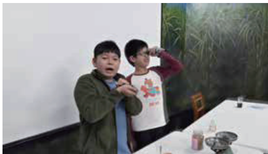
甘蔗的一生活動-甜蜜的負擔 用糖度測量各式含糖飲料的糖度，並講解糖度與甜度的不同

糖是生活上的必須食物，和每個人都有不可分割的關係，藉由課程讓學員認識糖的原料-甘蔗，並走訪製糖工場，實地解說，讓學員瞭解蔗糖的製造歷程之外，也感受到製糖是一友善環境的產業，取之於自然，還之於自然，使學員對周遭的環境多一份關懷。