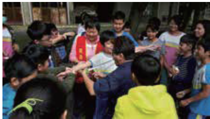
糖廠歷險記古蹟與老樹之謎用簡便儀器測量樹的腰圍，測定其是否符合老樹資格