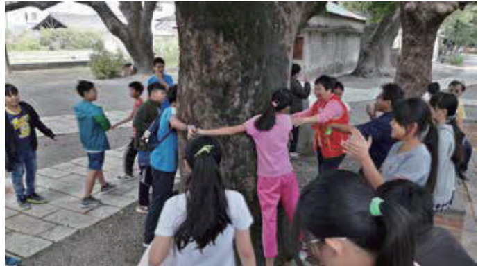
糖廠歷險記活動-古蹟與老樹之謎用簡便儀器測量樹的腰圍，測定其是否符合老樹資格

橋頭糖廠，是台灣由受獸力壓榨進入機械壓榨製糖的第一座糖廠，也是帶領台灣進入工業化的火車頭。園區除了原有製糖工場的現地解說外，藉由環境教育主題活動的引導，將糖業的歷史文化及橋頭糖廠古蹟建築，呈現世人，讓民眾更容易貼近製糖產業的興衰與在地生態環境匯流而出的獨特文化。