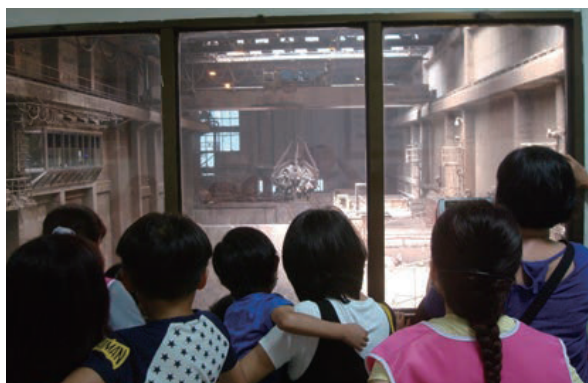
中區廠吊控室-觀摩垃圾貯坑及抓斗

正確的資源回收概念需要從小建立，中區廠希望環保工作能從小扎根，向上結果。因此，在本教學單元中，希望小朋友能認識垃圾分類，學會隨手做好資源回收的工作。並幫助小朋友建立「垃圾亂丟成髒亂，垃圾回收是資源」的概念。希望透過教學活動，落實小朋友資源分類與回收的具體實踐。