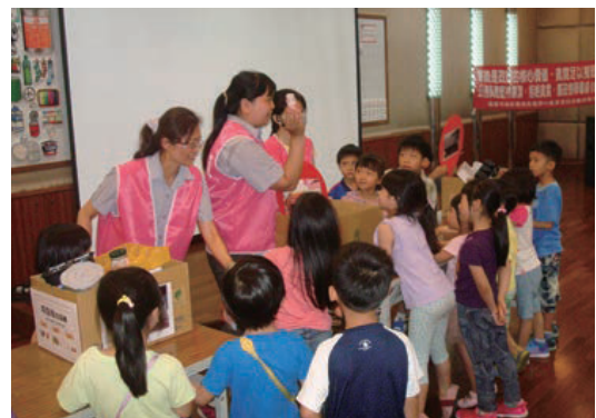
中區廠簡報室-環境教育活動