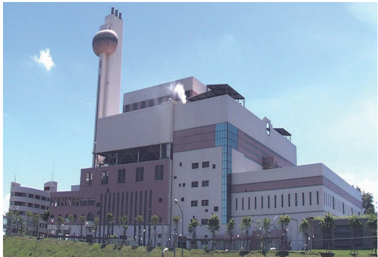
中區資源回收廠外觀圖

本廠教導民眾認識垃圾處理過程(垃圾進廠→垃圾貯坑→垃圾進料→垃圾焚化)及廢熱回收再利用，透過互動方式分享各種環保資訊，教育民眾垃圾分類、資源回收的好處。並藉由實地參訪，支持資源回收、尊重環保、愛護地球。