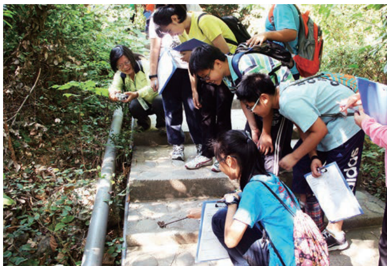
觀察臺灣獼猴的排遺

壽山國家自然公園成立於民國100年，是首座由下而上由民間推動的國家自然公園，也是鄰近高雄都會區的重要自然場域。它擁有獨特的高位珊瑚礁地質地形、豐富的動植物資源及珍貴的史前貝塚遺跡。為了讓更多人深入了解壽山地區的自然與人文資源，壽山國家自然公園成立了淺山學堂，規劃多種特色課程，期能讓來參與的民眾了解壽山、愛護壽山。