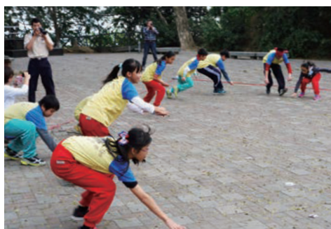
真相搜查隊—從遊戲中學到多線南蜥對原生種蜥蜴的影響