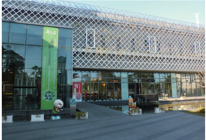
榮獲黃金級綠建築的郭元益糕餅博物館

郭元益為了保存臺灣糕餅的珍貴文化資產，於2001年在楊梅工廠及士林老店，創立了兩間「郭元益糕餅博物館」，藉著各類型充滿創意的活動，將文化傳承的課題變得更饒富趣味。2012年，更成立全臺食品業首座「黃金級綠建築」的綠標生活館，以環境教育讓所有人在享用美味糕點的同時，也能共同珍惜擁有、愛護自然，將環保的理念落實於生活中。