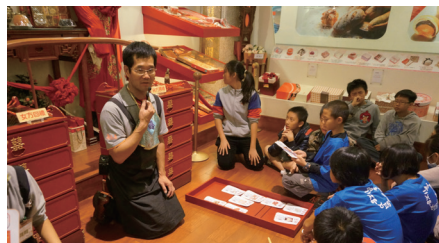
傳統生命禮俗的導覽解說

本課程教學重點在於讓學生了解全球暖化是當今最受重視的話題。課程中將會探討二氧化碳的來源，介紹碳足跡與碳標籤的內涵，以及碳足跡的基本計算方法。說明產業與經濟發展宜考量本土的自然和人文特色，進而引導學生了解減碳的重要性，並在日常生活中能夠加以落實，讓大家能知道全球暖化的影響是非常深遠。