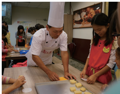
有趣的糕餅手作體驗活動

課程將介紹綠建築的設計理念與其應用。活動過程將會透過郭元益綠標生活館之導覽與解說，讓學生從中了解綠建築生態、節能、減廢、健康之四大主軸，藉以傳遞如何減少消耗地球資源，同時兼顧環境永續發展之概念，引發學生對於日常環保生活之認同，進而實踐並推廣環保生活。