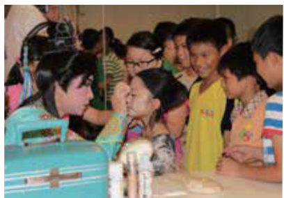
可以發揮巧思創意裝扮的歌仔戲容妝體驗單元，十分吸睛，激發大家學習熱力