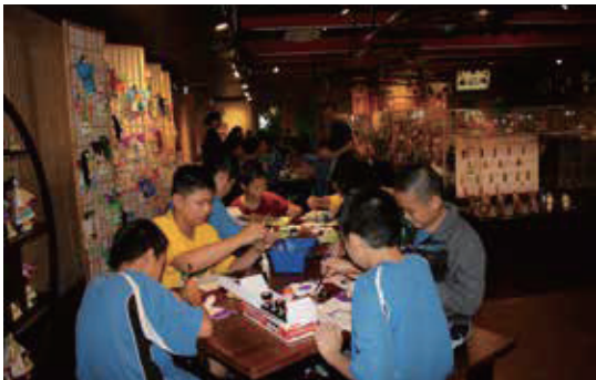
小朋友發揮創意，彩繪環保布袋戲偶，成果並展示在博物館內供遊客欣賞

課程名稱：大家來扮歌仔戲 授課對象：國小中年級、國小高年級 授課時數：3小時 授課季節：全年 課程簡介：