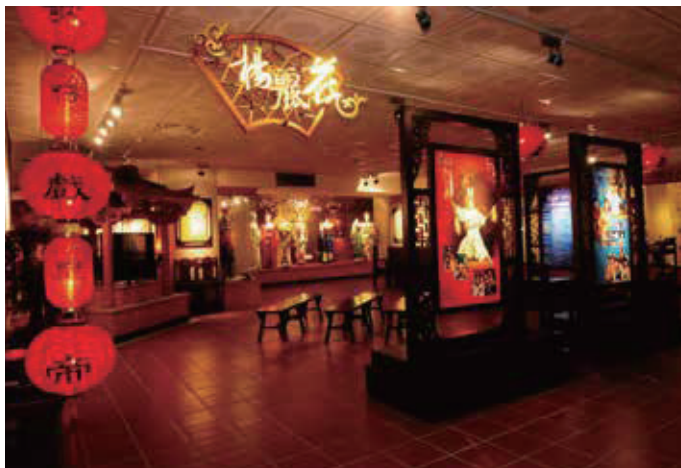
台灣戲劇館是一座環境清幽，充滿傳統氛圍的戲劇博物館，內含豐富展品，是一處極佳的環境教育（文化保存）場域

台灣戲劇館設於宜蘭縣政府文化局內，為文化部博物館之一，也是台灣首座公立地方戲劇博物館。以歌仔戲（主）、傀儡戲、北管戲曲、布袋戲（輔）為維護範疇。兼具戲劇展示、傳承教育、表演推廣、蒐集典藏、研究出版等多重功能，館藏豐富、展示精彩、戲劇推廣活動熱絡，是維護民間戲劇的重要場所。另為散播戲劇種籽，將珍貴技藝往下紮根，並附設「台灣戲劇館歌仔戲傳習班」。