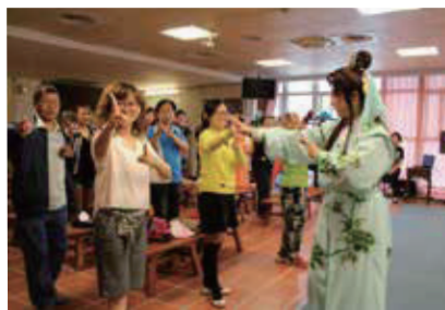
比手劃腳唱歌仔單元，學員熱情參與，學習興趣十分濃厚