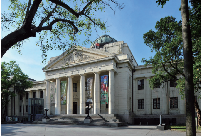
位於二二八和平公園裡的臺博館總館，是一座百年的經典公共建築物，也是一個展示臺灣自然史與全球環境重要議題的寶庫，公園內也有豐富的動植物生態