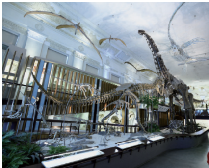
原為銀行建築物的土銀展示館，現在是古生物化石與恐龍的家，帶領大家穿越時空，來一趟地球生態演化之旅

臺博館四館所皆為日本時期古蹟建築，結合自然資源保育與文化資產保存概念，是與您一同關心臺灣這片土地與地球生態的博物館系統。