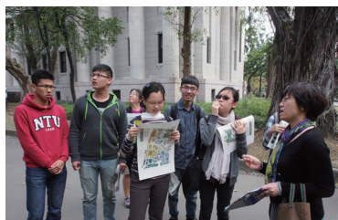
都市博物學家計畫調查公園物候

臺灣重要樹種 - 「樟樹」能煉製樟腦與其他相關產品。日據時代靠外銷樟腦賺大錢，也影響臺灣當時社會發展與環境生態。課程由穿越到現代的製腦工頭「腦長」，透過徵選「腦丁」，帶大家從各方面體驗如何當一個「腦丁」，了解從樹變腦的過程，樟腦的各項用途，進而討論煉製樟腦對臺灣當時社會文化與生態的影響。