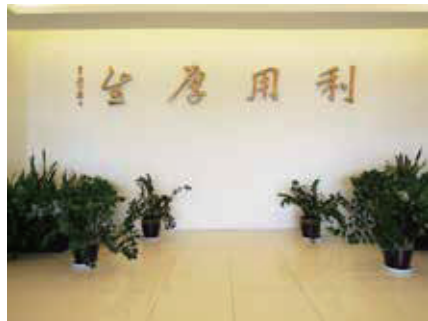
迎賓大廳以「利用厚生」為中心的信念，將廢棄物進行最佳化的資源再利用，物盡之用