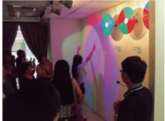
光的體驗區，感受光的混色與不同燈管的視覺差異

本課程設計理念主要為傳達廢棄物是資源之價值觀，引導學員擁有珍惜及感恩現有物質資源的態度。以本場所廢燈管及廢PCB電路板的資源化處理為案例，觀察經處理後之資源物質可進行多樣化再利用用途，思考資源回收的重要性。並透過使用再生材料製作水泥杯墊的DIY活動，讓學員感受動手做的樂趣。