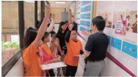
環境教學走道，透過玻璃帷幕可看見廢棄燈管燈泡的資源化處理流程與解說。