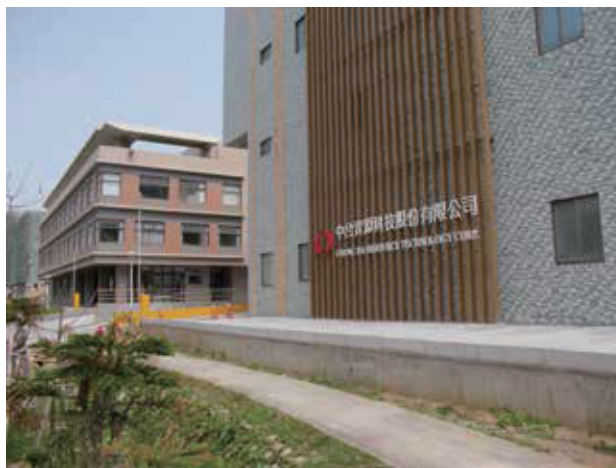
中台環境資源教育中心外觀

本場域主要呈現廢棄物資源化處理，生產為可再利用的資源材料，重新賦予廢棄物新生命達到循環經濟零廢棄的目標。「中台環境資源教育中心」學習走廊的展示內容，可以讓學員瞭解從廢棄回收到資源再生的循環歷程。學習內容強調做好分類回收的重要性，與廢棄照明光源回收，避免燈管燈泡破裂，以免重金屬「汞」產生對環境汙染與人體健康的危害。另外，本場域也提供再生材料水泥杯墊DIY，可以讓參加環境教育活動的民眾，親身體驗的趣味。