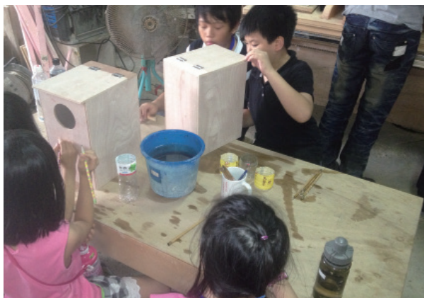
打造貓頭鷹的家-彩繪貓頭鷹巢箱