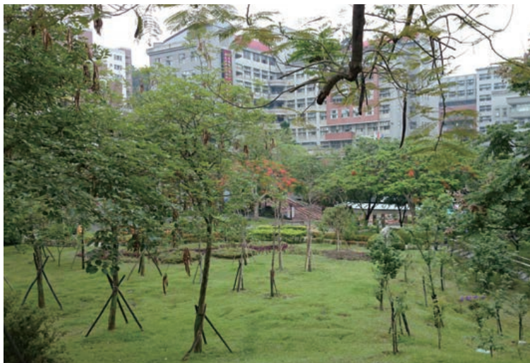
設施場所綠化情形

朝陽科技大學位處臺中盆地東南方，占地面積達66.4公頃，為營造生態豐富校園，除第一期校地(約18公頃)外，其餘都保留自然形態。經過多年努力，目前綠覆率達94.43%。除生態校園外，本校也整合「節能節水綠建築」、「水資源」及「自然環境與防災」等課程特色，提供多元的環境教育學習課程，並希望與大家共同為環保一起努力。