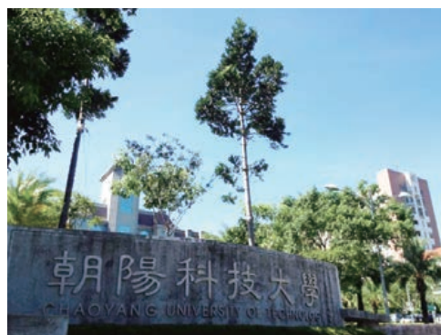
設施場所大門入口處