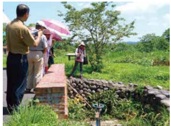
大自然奇妙的濕地水質淨化之旅 新竹縣竹東頭前溪水質生態治理區1、2期

透過雙腳和溫度計來感受、紀錄植物所改的溫度，了解植物對環境降溫的幫助；再讓學員藉由扮演生物，了解植物和環境依存關係，探討缺少植物對生物的影響；最後再利用繪圖和討論的方式，讓學員思考植物對人類、生物的重要性，進而愛護植物、保護地球。