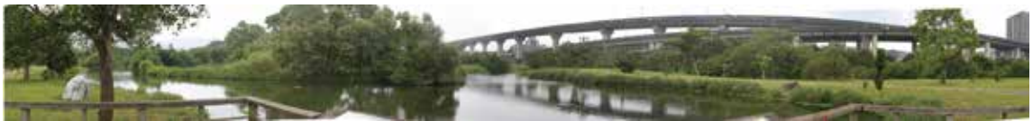
自然生態、人工造景與公共設施的和諧融合

學習望遠鏡的使用，了解圖鑑的使用，並利用學習的技能，加以觀察紀錄園區內的特色鳥類，繪製討論分享不同鳥類的習性後，藉由棲息地大作戰的遊戲內容，了解人類與環境的依存關係，培養人類與自然環境的和平共存。