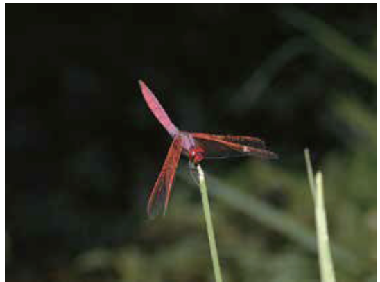
共同創造適合各種生物依存的溼地環境—紫紅蜻蜓

教師由A池到P池依序解說各池水生植物的功能與特性，並利用學習單進行觀察、認識和紀錄，再透過討論和分享，學習面對環境議題時，能傾聽、閱讀別人的想法，並理性提出質疑和說明，以體認愛惜水資源。