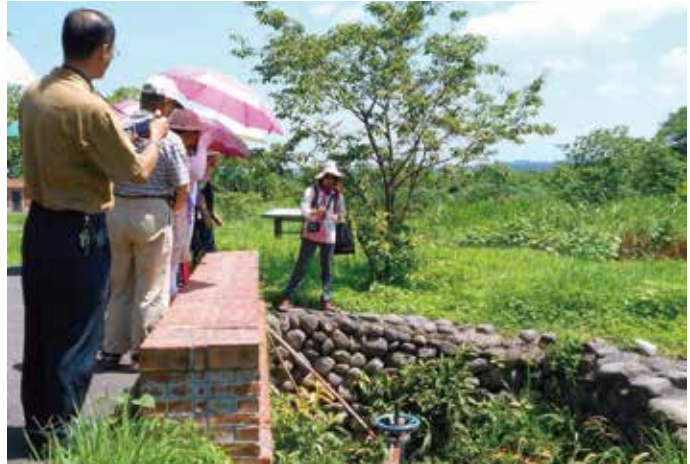
大自然奇妙的濕地水質淨化之旅

頭前溪生態公園配合河川生態治理理念，自93年設立迄今，仿造天然溼地，透過各個水質生態治理池，淨化竹東鎮排入頭前溪的家庭污水。並配合場域豐富的空、水、陸資源與特色，開辦包括「認識新竹縣竹東頭前溪生態公園」、「濕地樂園」、「水世界面觀」、「植物觀察家」、「鳥類大代誌」、「綠色養樂多」、「水草點點名」與「小小兵出任務-尋蝶找花趣」等總計共八個課程教案，提供參訪學員學習和體驗，並期協助實踐環境永續之行為。