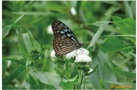
運用身體感官欣賞生態與自然之美—琉球青斑蝶與光冠水菊

教師經由A池到P池依序導覽，介紹人工濕地透過沉澱、過濾、吸附和吸收、微生物分解和水生植物等機制，逐步改善水質；並說明人工濕地具有省能源、低成本、不需添加化學藥劑和無二次汙染等優點，以引導學員愛惜水資源，從源頭節省水資源並減少污染排放。