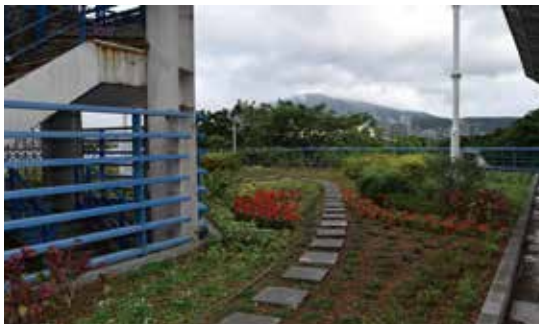
薄層式綠屋頂： 覆土深不超過30公分，中心綠屋頂種植了鐵炮百合、臺灣澤蘭...等原生物種，另外還有檸檬、金桔等可食植物。

永續環境育中心臨近挖仔尾生態保留區，藉由親身走訪挖仔尾溼地，了解挖仔尾的繁榮與沒落、認識招潮蟹、彈塗魚等溼地動物外，更了解由水筆仔紅樹林區的生態重要性，了解溼地的美麗與哀愁，體認溼地保育的必要；培養愛護溼地的環境覺知及實際行動。