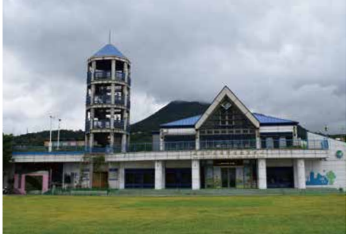
改建後的環教中心，符合節能、減廢、生態等綠建築指標

作為新北市長期推展永續環境教育的中樞，環教中心提供「綠建築」、「低碳教育」、「環境變遷」、「服務學習」等多項課程及展覽，透過生活實踐方式讓參觀民眾了解環境教育的內涵。中心亦提供團體預約導覽，免費為參訪團體進行環境教育解說。