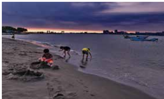
淡水水畔： 淡水河左岸的八里渡船碼頭向北是沙岸，退潮時的沙灘在夕陽的照射下別有一番風情。

永續環境教育中心藉由小瓦與小特水資源展板導覽，觀察中心雨水回收系統與水生植物區，並透過親手操作水淨化小實驗，了解水的珍貴與回收再利用的過程，最後能成為省水小達人。過程中並探討水汙染對生物的影響，提升其環境素養。