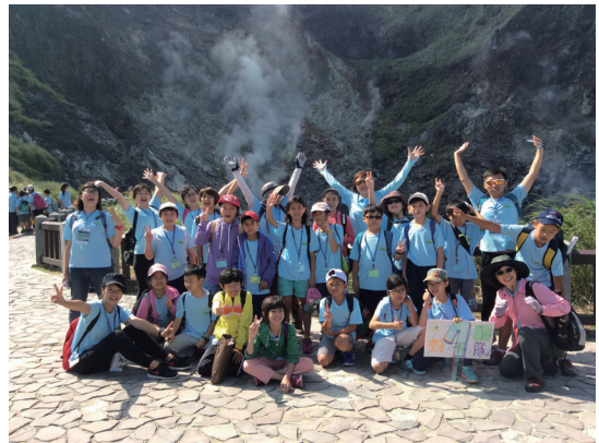
火山之旅-可開啟更敏銳的感官覺知

A：「小」是因為該地硫磺產量比大油坑少；「油」是指硫磺在高溫下會成為油狀液體；「坑」所指的是低窪地形。