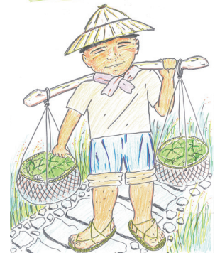
古道秋芒之旅宣傳海報(擔魚人)