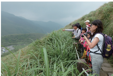
火山之旅-可在登山活動中了解火山地景