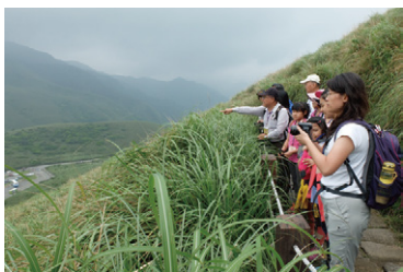
火山之旅-可在登山活動中了解火山地景