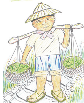
古道秋芒之旅宣傳海報(擔魚人)