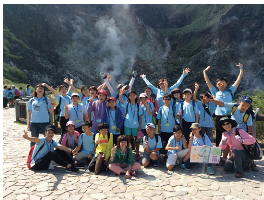
火山之旅-可開啟更敏銳的感官覺知

A：「小」是因為該地硫磺產量比大油坑少；「油」是指硫磺在高溫下會成為油狀液體；「坑」所指的是低窪地形。