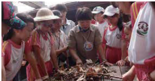
「Happy探索趣」課程，透過觀察、操作體驗，認識黑面琵鷺生態習性

台江曾是臺灣對外的重要門戶與發展舞台。荷蘭人以台江為指揮中心，鄭成功由此登陸；清朝視台江為重要軍事隘口。台江內海經過積年累月的淤積，環境變遷影響人類生活與社會發展，本課程透過角色扮演、闖關猜謎、探索與遊戲，讓學生重返歷史現場，瞭解台江的演變與人類社會發展之緊密關係，揭開深藏台江四百年來的祕密。