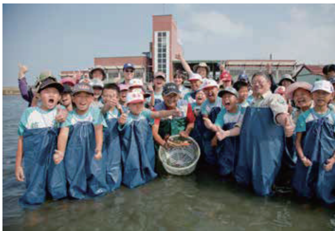
濕地即學校，魚塢即教室，台江國家公園是最佳戶外學習樂園

台江國家公園是臺灣唯一濕地型國家公園，擁有多樣濕地生態、先民移墾歷史場域及傳統漁鹽產業文化，薈萃了「自然」、「歷史」與「產業」等三大資源特色。基於生態保育理念，101年成立「台江濕地學校」作為環境教育創新推廣品牌，以豐富、趣味、多元的教學方式，引領大眾及學校師生深度感受濕地生命與在地文化，並思考如何從自身行動中落實環境保育之理念。