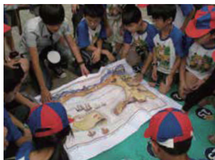
「台江時空膠囊」課程，以闖關解題方式，帶領學員穿越時空，認識台江歷史與文化