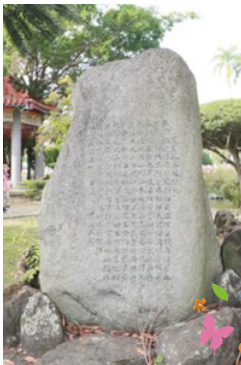
庭園花木培植記石碑