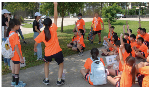
教案二植物園區的奧妙

課程結合臺灣民主發展史與議政園區建園理念，透過尋寶遊戲探索、解謎任務，引導學生認識建園時「尊重環境、愛護環境」理念延伸至今，體現環境永續。