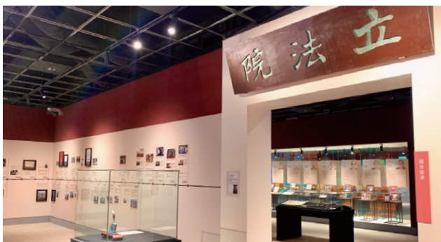
議政博物館民主之路展區

課程以立法院議政博物館為學習場域，結合立法影片、導覽解說與互動任務，帶領學員了解透過民主制度，社會能將不同的聲音納入，回應公共需求，並將其轉化為具體的法律規範與生活保障。