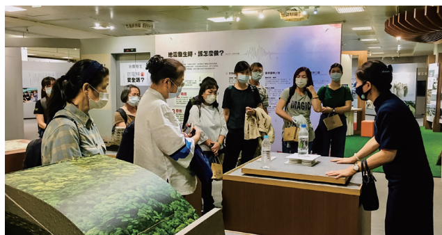
友善大地館~科普教育 教學照片