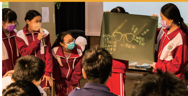
永續未來館~環保黑板布 教學照片

地址：臺中市南屯區文心南路113號 聯絡電話：(04)40510777#4102~4106 客服信箱：mickey.wenwu@gmail.com 網址： https://bit.ly/3fyZWs4 開放時間：09:00~17:00