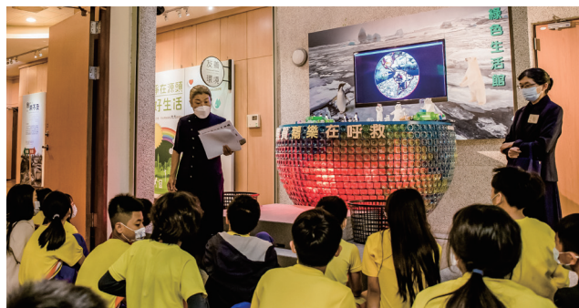
綠色生活館~發燒的地球 教學照片