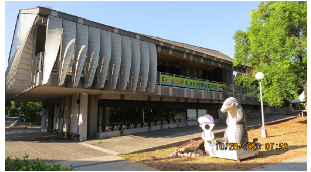
東海大學環境教育館

推動環境教育學習，以「生態環境特色、校園歷史古蹟聚落建築群文化保存特色」循序漸進方式，培養學生對環境的覺知，並藉由各種型式的环境教育課程，增進環境知識和正向的環境價值觀，引導學生學習解決環境問題的技能，進而主動參與保護地球環境之行動。本著「與環境共生」、「與自然融合」的核心精神，致力於保護自然環境，確保生態多樣性，維護生態平衡，建構一個具有人文、藝術、科技、生態和教育五大多功能的校園，以展現自身對環境保護與社會責任，積極投入環境教育，邁向環境行動與資源永續的新里程碑。