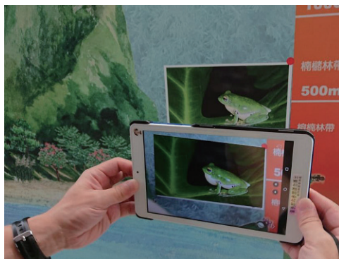
照片裡的動物動起來的秘密