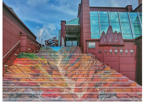
火炎山生態教育館

火炎山生態教育館座落於苗栗縣三義鄉，為一幢地上三層地下二層之景觀建築，無論是外觀或內部設計，皆呈現火炎山獨樹一格的天然特色。是國內少見針對自然地景所設置的展示解說教育場域，秉持「宣導生態資訊、落實保育行動」的宗旨，作為國民認識台灣自然環境及保護（留）區相關資訊的窗口，及在地保育工作的行動平台與教育場域。