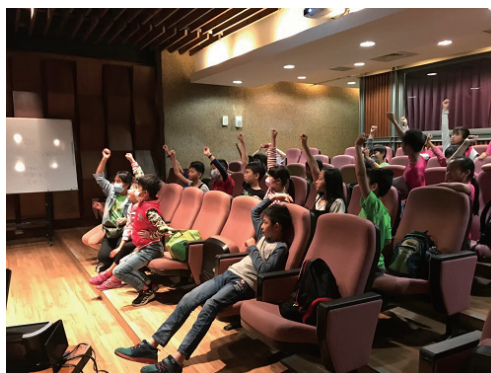
踴躍參與課程的學員們

三義地區擁有豐富的自然景觀及人文資源，亦是台灣石虎的分佈熱點，為宣導石虎保育議題將結合淺山地區動物保育進行推廣工作，以淺山議題為主軸，透過投影片和影片讓學生對主題有初步的了解及認識，最後再透過遊戲互動加深印象。