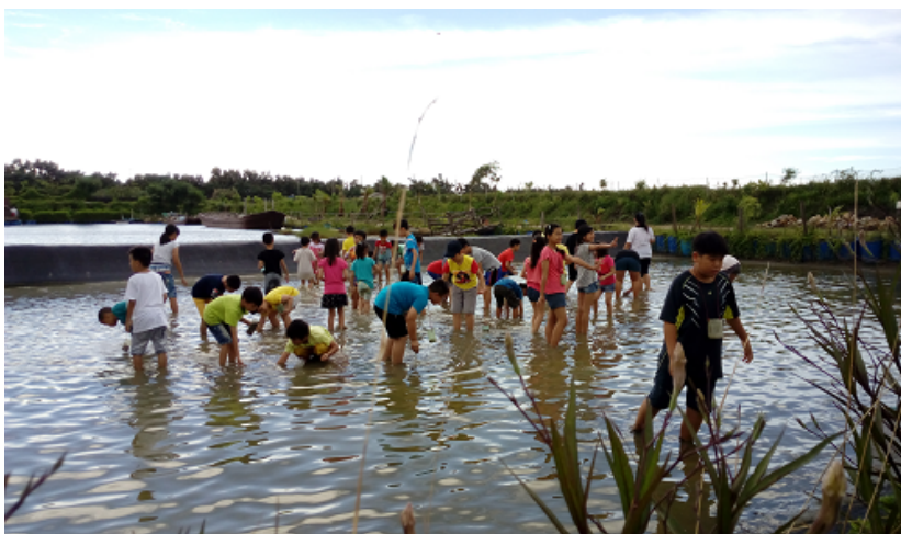
摸文蛤-漁事體驗學習，知道如何摸取技巧，並會做胎選大小達到永續。