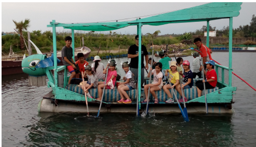
撈海菜-淺水養殖區體驗漁夫打撈海菜辛勞並做料理品嘗，學會感恩不浪費。

為顧及生態環境與安全實用漁產，漁場以自然養殖方式養殖，魚池內以混養虱目魚、吳郭魚、草蝦、螃蟹、文蛤、螺做為食物鏈的生態系統。池畔種植紅樹林，土堤為自然生成耐鹽耐風的植物及南美蟛蜞菊，以上植物不但可以護堤固土，還可以吸引濕地的昆蟲與鳥類覓食棲息。