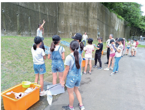
擋土牆、土石流教學場地

目前新竹面臨了哪些環境議題，而這些問題對頭前溪又有何種影響呢？科技的進步經濟的發展，農業、畜牧業、及其他工業多數會產生廢水，而我們生活鄰近的頭前溪亦有可能遭受其廢水污染，一般而言廢水需經過處理才能排放至溪流，為此希望提升學員公害防制之意識及觀念，若發現河川遭受污染應該如何解決。