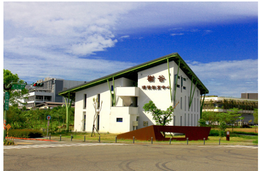
置身在臺南新市樹谷園區的「綠風箏」，不僅美觀、新穎，更是符合綠建築設計及低碳理念雙重認證的友善建築物。

後於2019年通過「環境教育設施場所」認證，發展「考古、生態、食農」三大主題導向，透過探索思辨、文化理解，嘗試以先民與生物的角度，找回人類根本與土地共好的方法，希冀將環境友善的態度落實於日常生活。