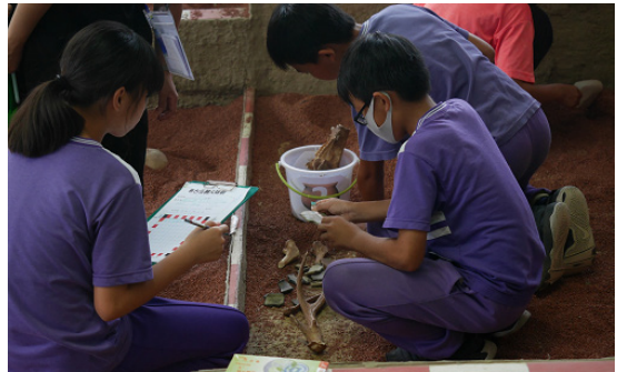
南台灣規模最大、擬真度也是最高的「考古探坑」，讓參與者化身考古學家「實際發掘」，進行一場場不斷被推翻的考古科學驗證過程。