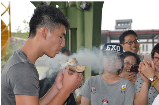
「回到未來」課程讓一般民眾體驗「鑽木取火」，探討現代工具對比史前在使用、損壞後所製造出的垃圾與環境污染危機，並學習以前人類和自然環境共存之道。

已知用火，是史前人類的重大進展，從一面牆探究土地下的痕跡，透過遺物分析其文化脈絡，皆與「火」息息相關；再嘗試以「原始生火器具」產生火種，藉由取火面臨的各種難度及挑戰，體會對先民生活的重要性，進而反思現代便利所付出的環境代價。