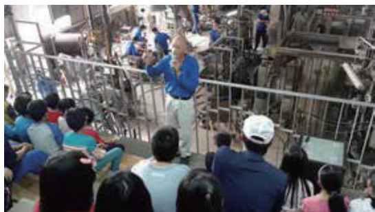
參觀玻璃藝品製作，見識到廢玻璃資源回收循環利用的成效