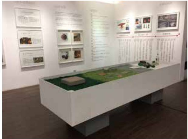
使用回收玻璃實物教材搭配大海報教學，讓學員瞭解資源循環利用，創造無限價值

本園區從事廢玻璃回收循環再利用已50年，廢棄玻璃經處理後製成各項產品，減少資源開採；同時達到垃圾減量，以「環保人文保護、百年手工技藝」、「廢玻璃回收循環再利用友善環境」為教案設計主軸，推動「綠能環保教育」為活動設計主題，讓參訪學員們觀賞百年技藝—手工玻璃藝品製作，及讓學員瞭解資源循環利用對環境保護的重要性，進而落實愛惜資源，創造友善環境，實現永續發展的願景。