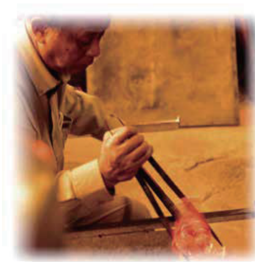
百年手工技藝、傳承玻璃文化