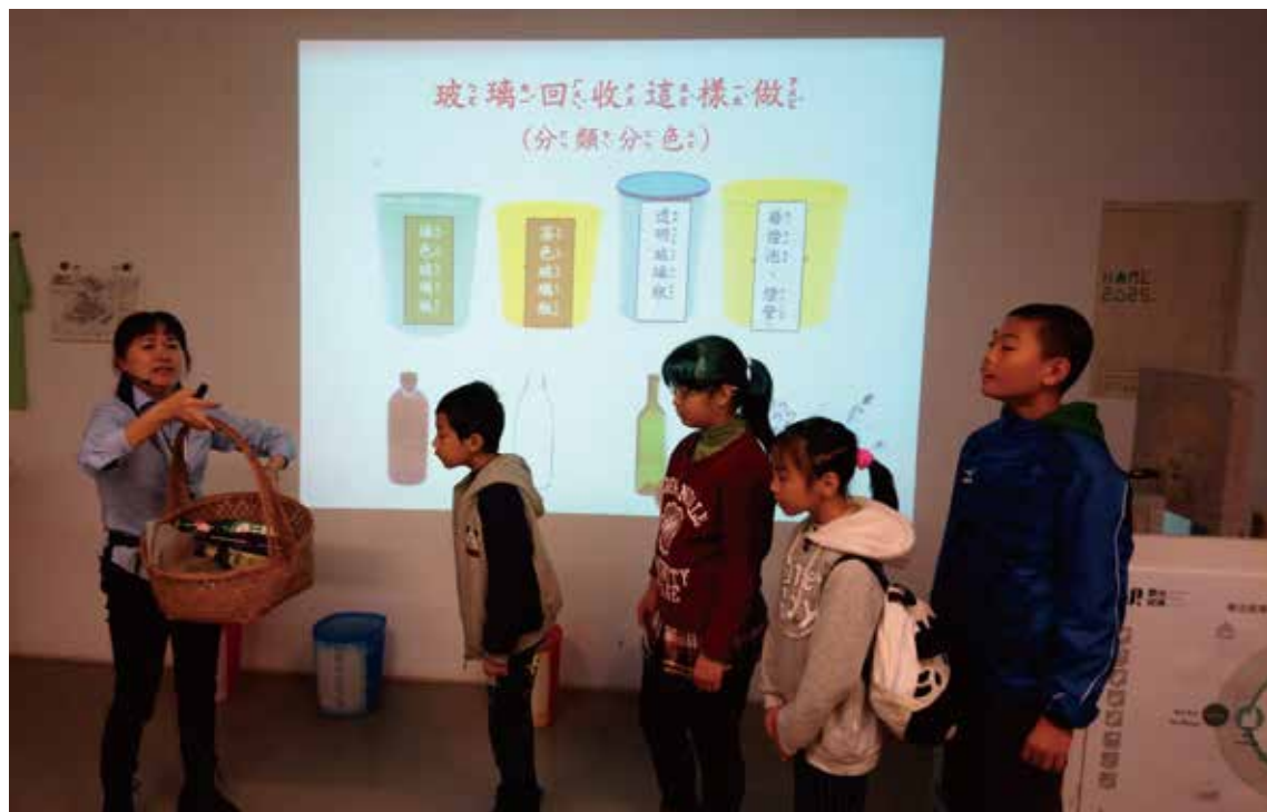
利用各項資源教材，執行回收分類工作，教導學員保護環境，「回收救地球」