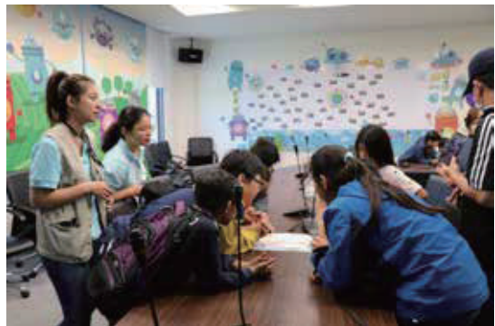
認識水魔界環境教育課程-小組討論