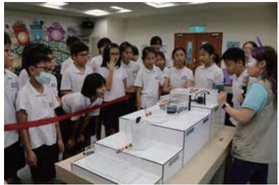
污水處理的操作流程好特別~!

2.運用引導教學實驗及遊戲互動方式，學習簡易辨別水能不能使用的方法，讓學員思考在日常生活裡，哪些友善環境的行為，可以降低污水的產生，啟發學員關心水資源與環境保護的目的。