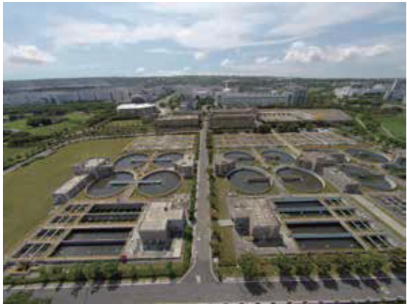
臺中市政府環境保護局后里資源回收廠

其廠區建築物環境資源教育展示中心為綠建築設計，符合相關指標項目如：綠化量、日常節能、水資源以及污水垃圾改善，設置環境教育教室，以水資源保育及污水處理為課程發展主軸，希冀透過課程教學體驗，進而達成環境教育覺知、知識、態度、技能、行為等五大目標。