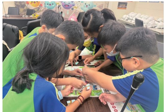
認識水魔界環境教育課程

2. 以室內課程、體驗教具等方式，結合國中課程（水循環），讓學員透過參訪污水處理廠，現場了解工業廢水處理流程，進一步反思如何減少水污染，並珍惜水資源。