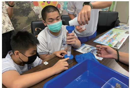
踏遍水魔界環境教育課程-過濾體驗好好玩~!