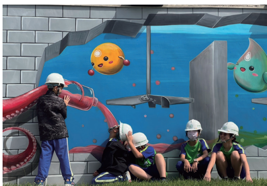
認識水魔界環境教育課程-廠區導覽互動區

2. 以室內課程、活動體驗等方式，結合淨零排放之議題，讓學員透過體驗活動了解淨零在生活中可以如何推動，台灣目前的趨勢為何，進一步反思如何在生活減少碳排，並珍惜資源。