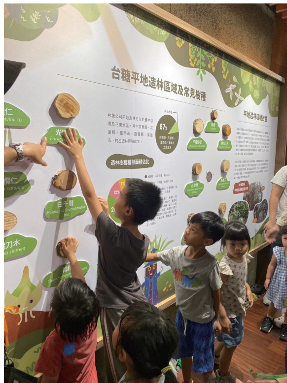
「橋糖碳險趣」課程認識平地造林與碳匯

「橋糖碳險趣」課程是聚焦於糖廠停閉後，甘蔗需求量大減，原本種植甘蔗的農田後續之應用，並於1987年開始將離蔗土地應於平地造林，作為自然碳匯的生力軍及綠色碳匯的儲藏室，並藉由課程讓參加者了解臺灣目前面對氣候變遷的嚴峻挑戰，並認識2050淨零排放的目標，了解糖廠蔗田「現在」改為平地造林之林地與「未來」臺灣碳中和的關係。