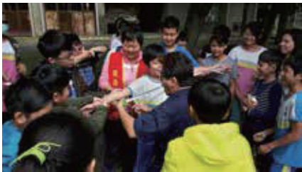
糖廠歷險記古蹟與老樹之謎用簡便儀器測量樹的腰圍，測定其是否符合老樹資格