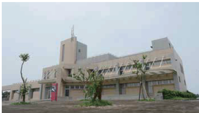
竹北水資源回收中心

本中心位於新竹縣竹北市，緊鄰鳳山溪，本中心占地約7公頃，為新竹縣第一座民生污水處理廠，處理完成的放流水排放到鳳山溪，有效降低鳳山溪的負荷。參訪本場域可以瞭解到污水從家裡怎麼來到污水處理廠的，污水處理廠又是如何處理從家裡來的污水，期望能夠改變日常生活使用水的習慣、愛護水。