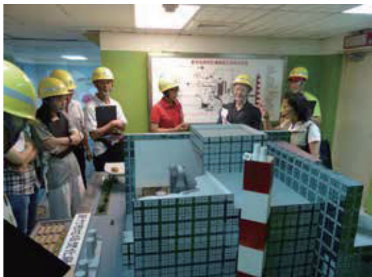
透過資源回收廠的立體模型，向學員介紹該廠的建築特色及垃圾處理作業的流程

本課程以鳥瞰、平視和地底下之視角的情境模擬，讓學員體驗香山濕地生態的多樣性與獨特性，激發守護濕地環境與生態的意識。