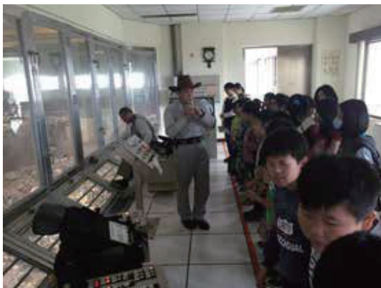
垃圾吊車控制室：垃圾收集、攪拌及投料作業。