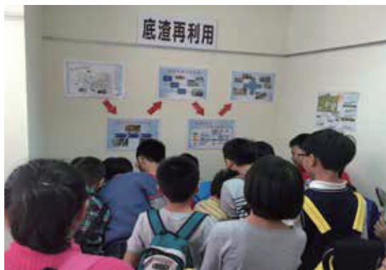
飛灰及底渣再利用教學區

本課程以「水資源保育」為主軸。后里焚化廠南臨大甲溪，北近牛稠坑溝，廠內的污水處理採用零排放(完全回收利用)處理方式，故無污水污染環境之虞。為免除民眾對焚化廠運作及污水處理的疑慮，由「大甲溪的前世今生」，讓民眾充分了解廠區的污水處理及水質監測機制，並於本廠區8樓的遼望臺觀察大甲溪的河川生態，進一步理解水資源保育的重要性。