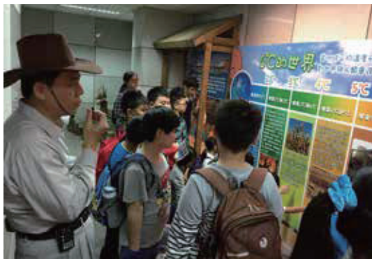
環境教育知識牆：氣候變遷及環境議題探討。