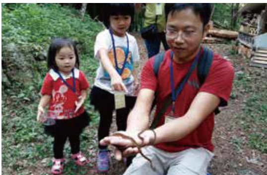
學員在教師指導下，認識蛇類的習性，與無毒的蛇類第一次接觸

八仙山擁有各式各樣的大樹小樹，請開啟身上所有的感知細胞，以觸摸、觀察、品嚐、聞香、感受樹木之美，並探索樹木的功能與重要性，與樹作朋友。