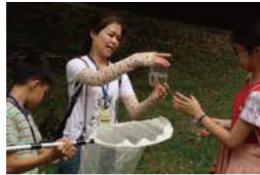
練習掃網技巧，以不傷害昆蟲的方式進行調查

八仙山是台灣的三大林場之一，想知道過去是什麼樣的盛況嗎？請發揮小偵探追根究底的精神，親身體驗八仙山早期林業開發的辛勞及林場的人文、生態之美。