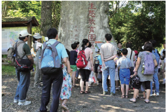
有3.5公頃的生態教育園區，提供戶外學習優質場域

園區之導覽設計為自導式雙語解說設施，並提供園區導覽摺頁供遊客使用。本中心野生動物急救站將救傷的野生動物，因無法野放成為保育大使於園區開放民眾參觀，是優質的環境教育學習場域。