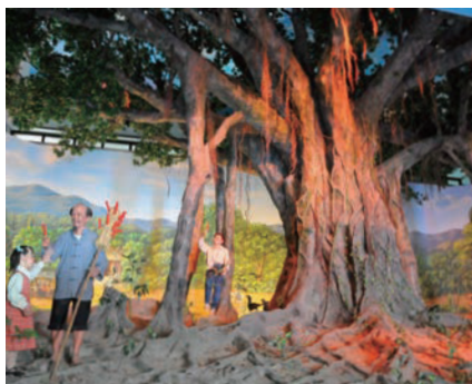
保育教育館1F大廳生命樹栩栩如生，讓民眾嘆為觀止