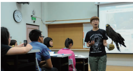
保育員進行野生動物SOS課程，述說大冠鷲救傷的過程

為甚麼是「慕光之城」？蛾是甚麼東東？蛾和蝶有甚麼差別？蛾在生態系扮演甚麼角色？蛾和人類有甚麼關聯？有哪些人研究臺灣的蛾類？