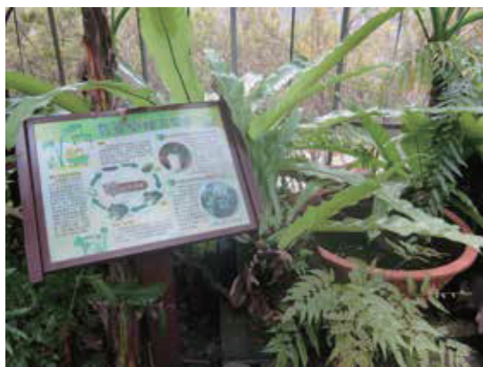
翡翠樹蛙復育園區內設置的大水缸，供樹蛙產卵繁殖用。