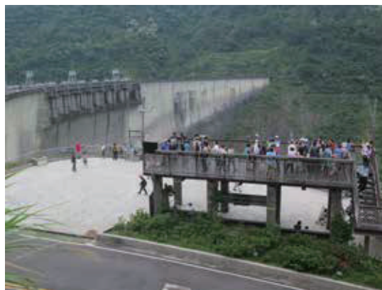
大壩觀測教育平台提供參訪民眾更佳視野