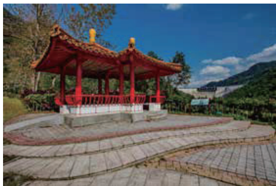
園區道路旁美麗的涼亭，可眺望整個翡翠大壩及下方的翡翠電廠。

本課程採互動式教學，透過教師講述、小組討論、密室逃脫遊戲等方式學習翡翠拱壩的原理、大壩的安全監控措施等。